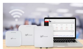
Sicheres, cloud-verwaltetes WLAN