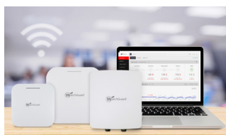
Sicheres, cloud-verwaltetes WLAN